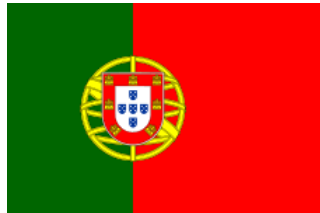
Nouveau drapeau :