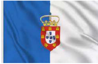
Ancien drapeau :